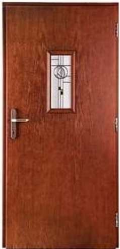
ATTACHE 2 Цвет: орех