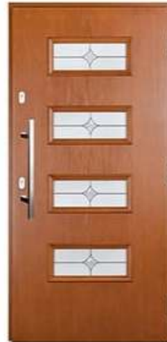
ATTACHE 10 Цвет: винчестер