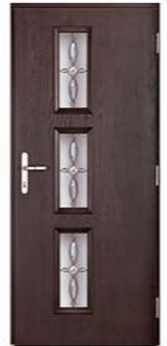
ATTACHE 14 Цвет: болотный дуб

Вы сами решаете, какой будет окончательный вид вашей композитные двери.