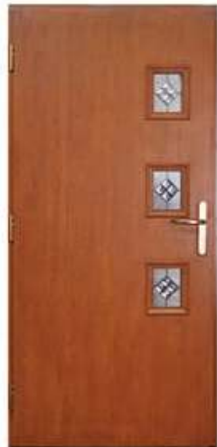
ATTACHE 5 Цвет: винчестер