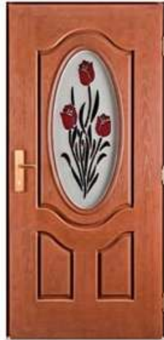
AMBASSADOR 2 Цвет: золотой дуб