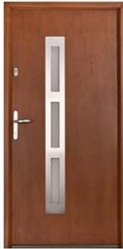
DIPLOMAT 42 Цвет: орех