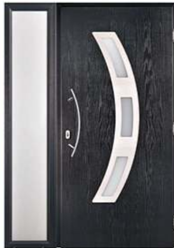
DIPLOMAT 22 RAL 7016