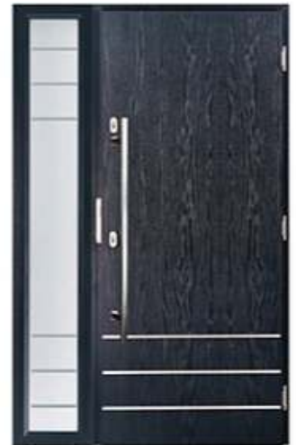
DIPLOMAT 0E RAL: 5008