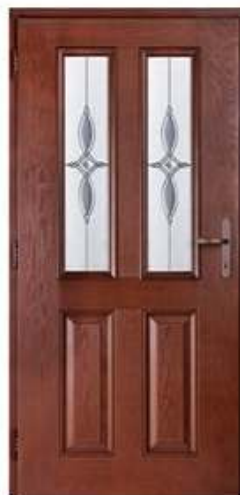
CONSUL 4 Цвет: красное дерево