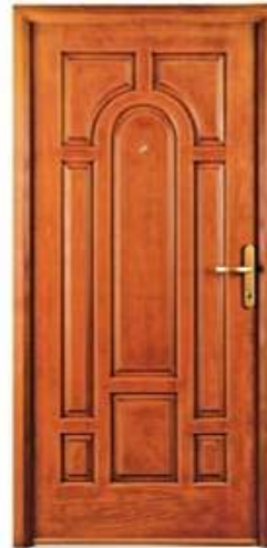
PRESIDENT 1 Цвет: золотой дуб