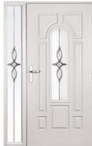
PRESIDENT 2 Цвет: белый