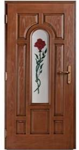
PRESIDENT 2 Цвет: орех