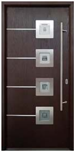
DIPLOMAT 40 Цвет: красное дерево