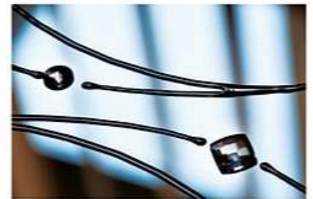
Kristal Swarovski - Новинка!