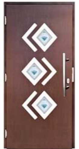
DIPLOMAT 80 Цвет: красное дерево

Представленные выше двери – это только несколько вариантов из многочисленных решений, которые могли бы быть.