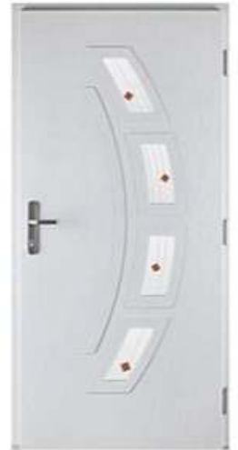
DIPLOMAT 20 Цвет: белый