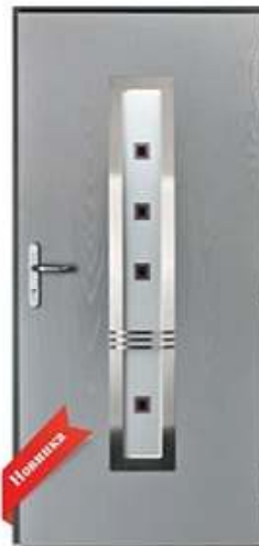
DIPLOMAT 46 + декоративная рамка RAL: 7040