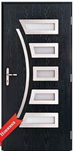
DIPLOMAT 26 RAL 5008