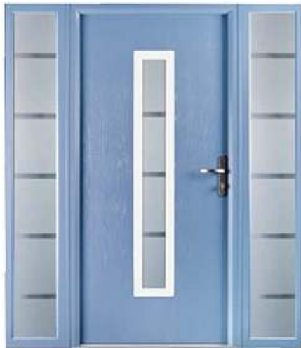
DIPLOMAT 46 RAL: 5012