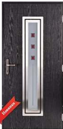
DIPLOMAT 4S RAL 7016