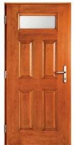
CONSUL 8 Цвет: золотой дуб