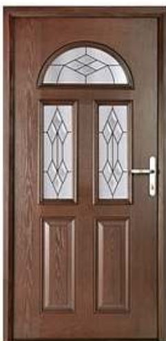
CONSUL 3 Цвет: красное дерево

Вы сами решаете, какой будет окончательный вид вашей композитные двери.