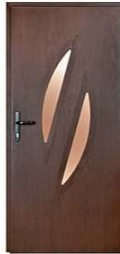
DIPLOMAT 64 Цвет: темный дуб