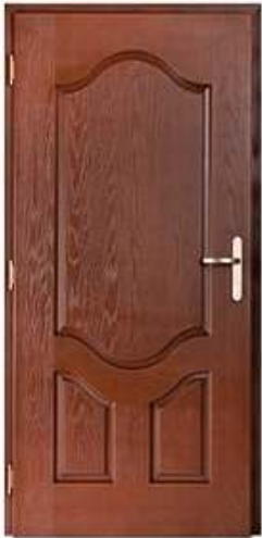
AMBASSADOR 1 Цвет: орех