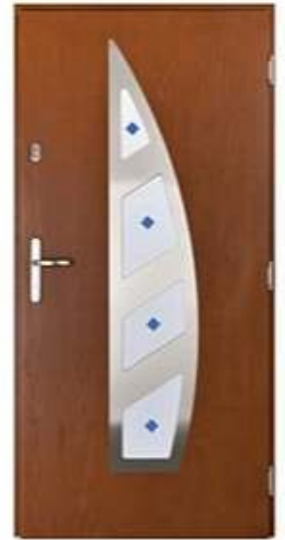
DIPLOMAT 73 Цвет: орех