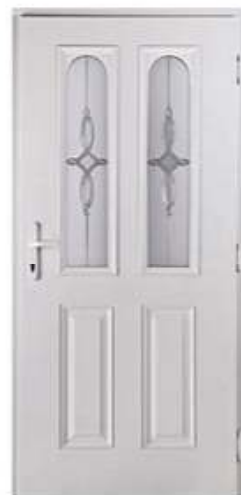
CONSUL 6 Цвет: белый