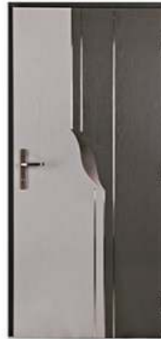
DIPLOMAT 0A RAL 7040 / 7016